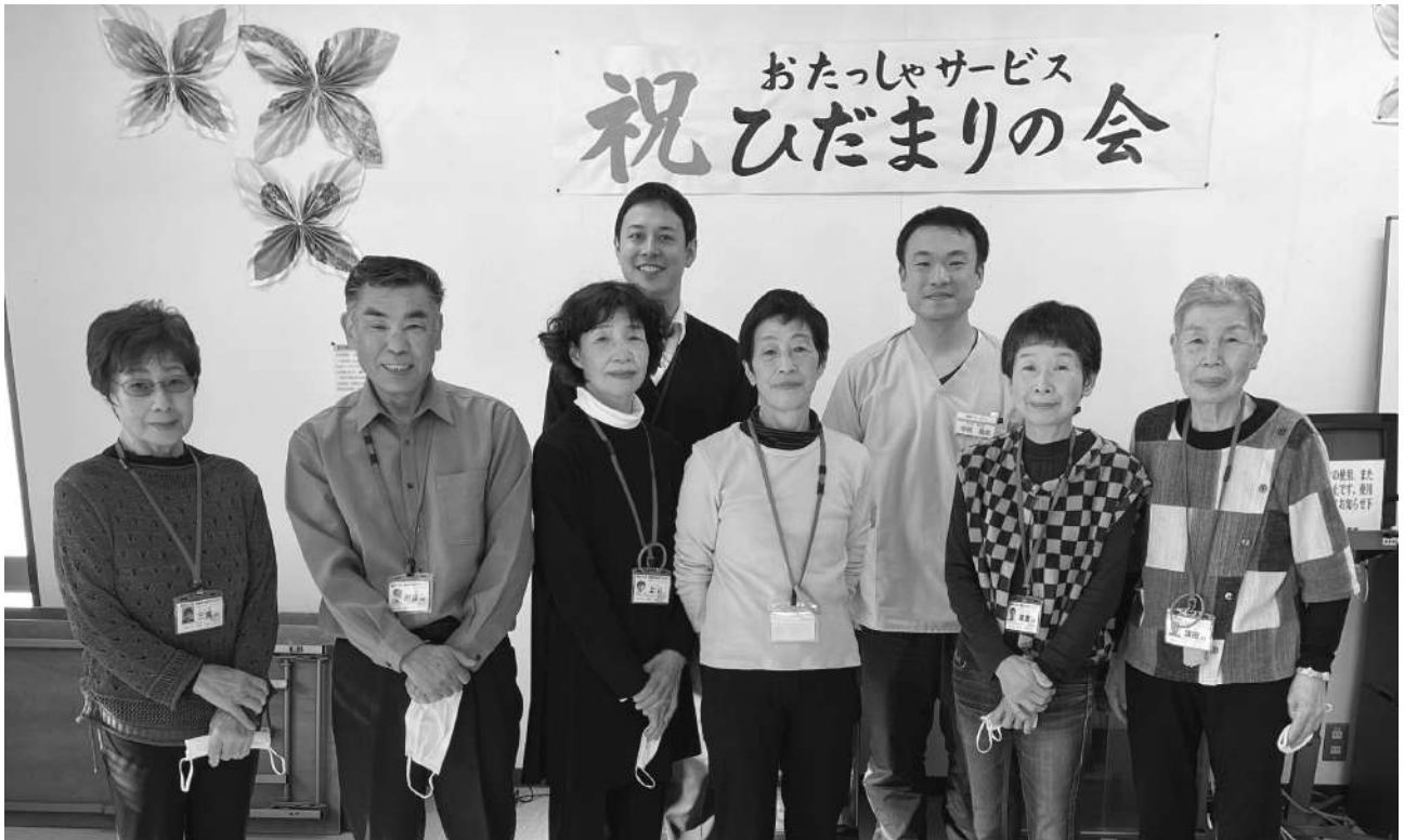
(前列：スタッフの皆さん)